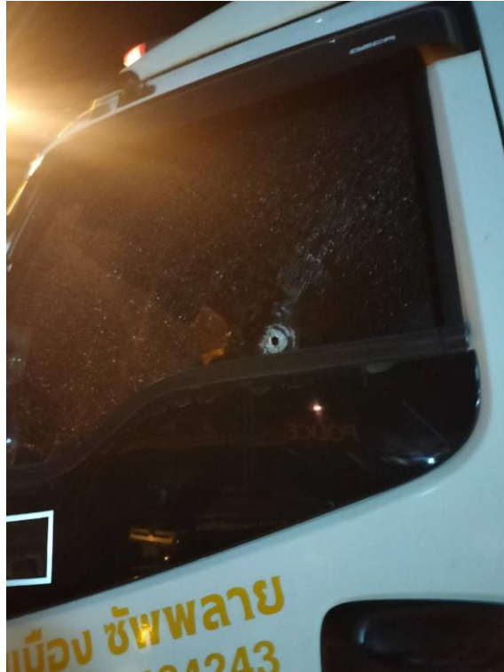
กระสุนถูกกระจกรถยนต์บรรทุก บริเวณกระจกประตูด้านซ้าย