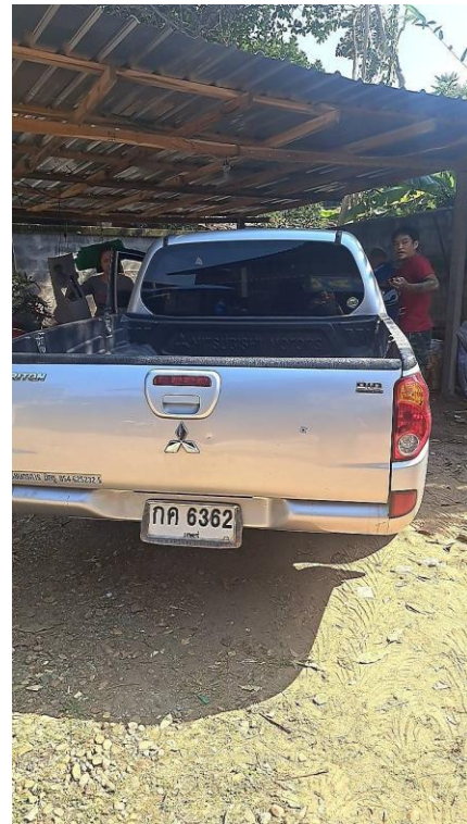
รถยนต์กระบะยี่ห้อมิตซูบิชิ สีบรอนด์ ทะเบียน กค ๖๓๖๒ แพร่ ที่ใช้กระทำผิด ซึ่งเป็นรถที่นายสุทิน ยานู ใช้เป็นยานพาหนะในวันเกิดเหตุ